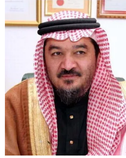
الأستاذ الدكتور توفيق بن أحمد خوجة أستاذ الصحة العامة نائب الرئيس الجمعية العربية للصحة نائب رئيس المؤتمر