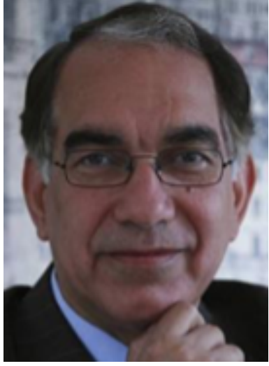
الأستاذ الدكتور سلمان رواف أستاذ الصحة العامة بامبريال كوليدج لندن رئيس الجمعية العربية للصحة العامة رئيس المؤتمر