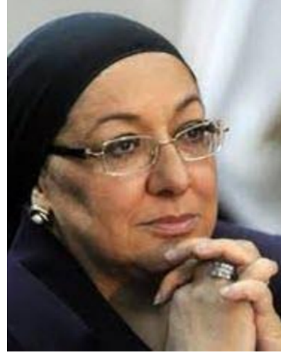
الأستاذة الدكتورة مها الرباط وزيرة الصحة والسكان المصرية السابقة الرئيس الشرفي للمؤتمر